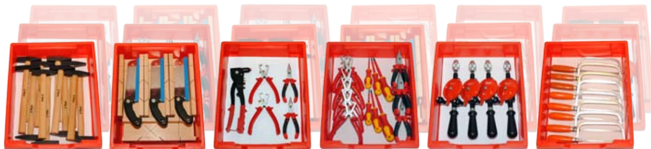
Laden met gereedschappen uit de rolkasten

Ga naar www.TechnieQ.org voor een software-demonstratie.