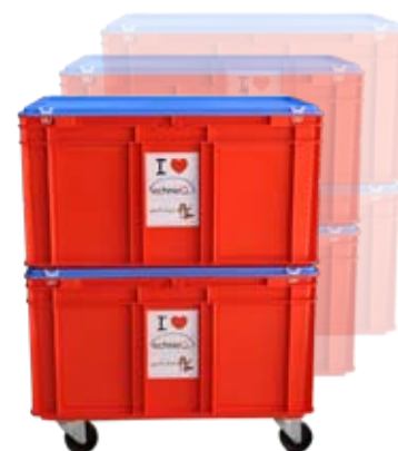
Eén kist per jaargroep voor de verbruiksmaterialen