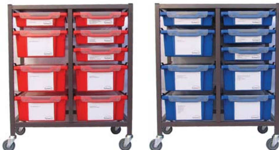
Overzichtelijke rolkasten voor alle gereedschappen